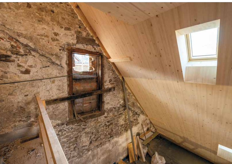
La substance bâtie historique permet d'y aménager des logements avec beaucoup de cachet.