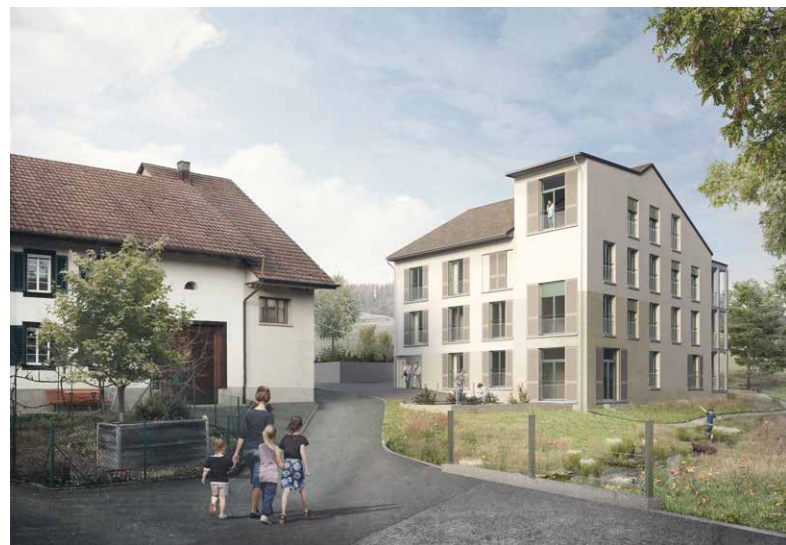
À Sulz, le projet lauréat «Wir von der Kleinstadt Vier» apporte une plus-value qualitative par rapport à une adjudication directe. Oliver Christen Architekten