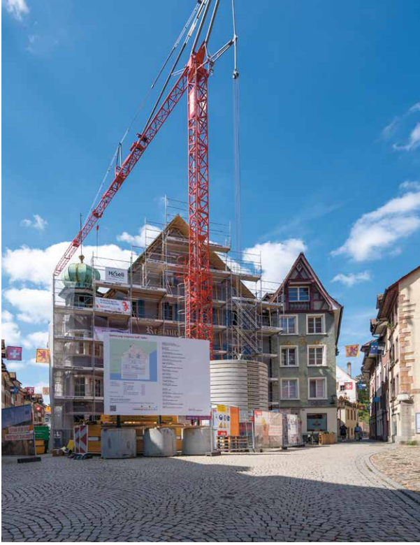
Laufenburg rénove elle-même l'immeuble Adler, dont elle détermine l'utilisation ...