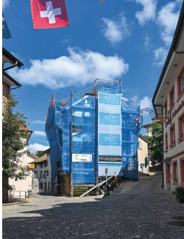
Le concept d'investissement de la commune lance un signal fort pour les privés, qui se remettent eux aussi à investir dans la vieille ville.

Actuellement, les autorités ont décidé de marquer un temps d'arrêt. L'exécutif municipal souhaite en effet attendre l'achèvement des deux projets en cours et dresser un bilan mi-