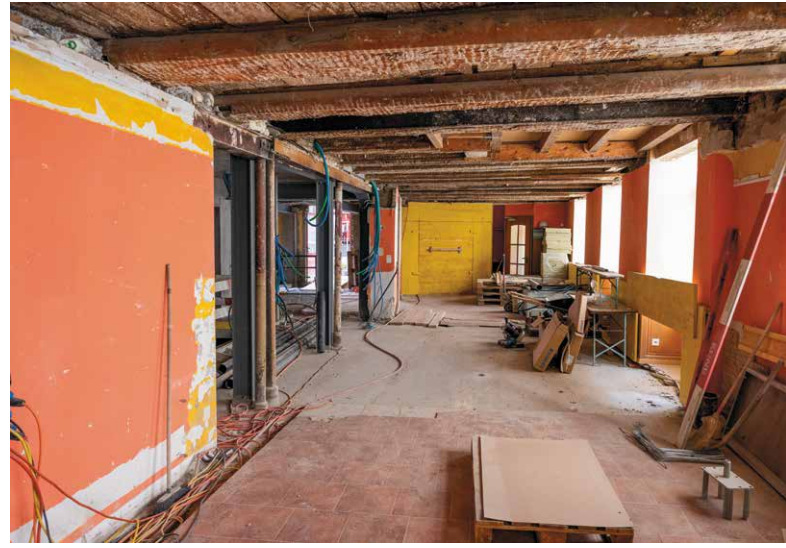
... et contribue ainsi à redynamiser la vieille ville: des logements, des bureaux et, bientôt, un restaurant (en image).