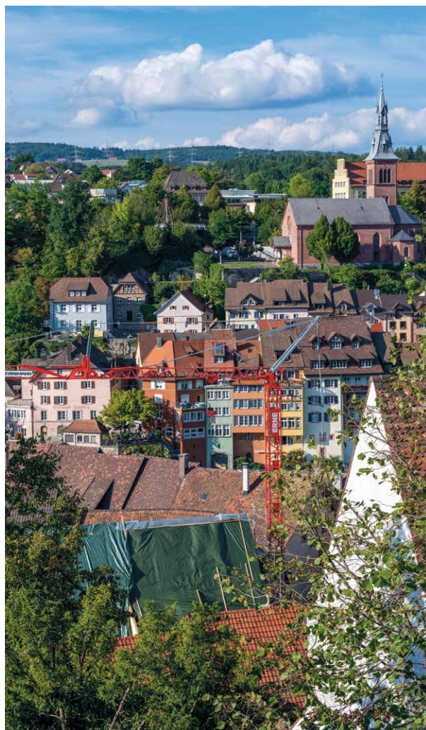
La commune a jusqu'ici investi env. 10 millions de francs dans quatre objets, deux dans la vieille ville de Laufenburg et deux dans la localité de Sulz.