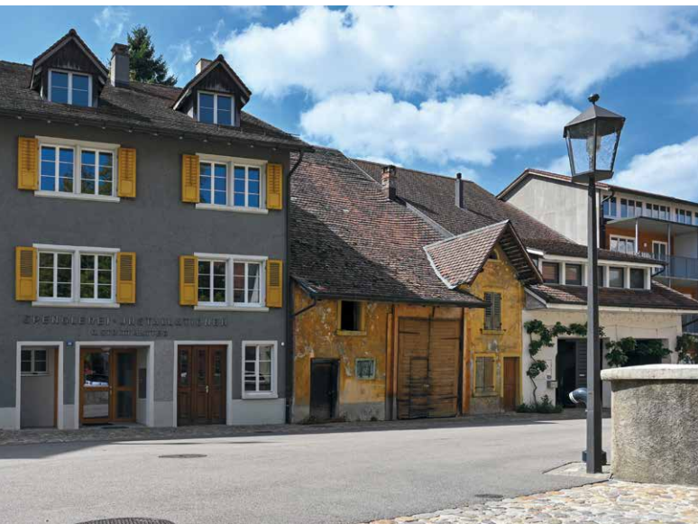
Certains bâtiments ont clairement besoin d'investissements.

pour un montant allant jusqu'à 3,5 millions de francs par objet. Un principe important veut que seuls puissent être achetés, en règle générale, des immeubles dont les propriétaires s'approchent eux-mêmes de la commune. La décision d'acquiescer se prend sur la base d'une estimation réalisée par un expert externe et payée par la partie privée, c'est-à-dire par le propriétaire intéressé à vendre. Cette estimation comprend une évaluation sommaire des investissements nécessaires. La question du rendement est ici centrale, l'objectif étant d'obtenir un rendement brut de 5 % et un rendement net de 2,5 %. De tels rendements sont plus faciles à atteindre dans le cas d'une démolition-reconstruction que dans celui d'une rénovation car, dans un immeuble ancien, le risque de surcoûts liés à de mauvaises surprises est plus élevé. De fait, ces objectifs doivent être adaptés aux spécificités de l'objet. De manière générale, la commune table sur un rendement modéré, ce qu'elle est toujours parvenue à obtenir jusqu'ici.