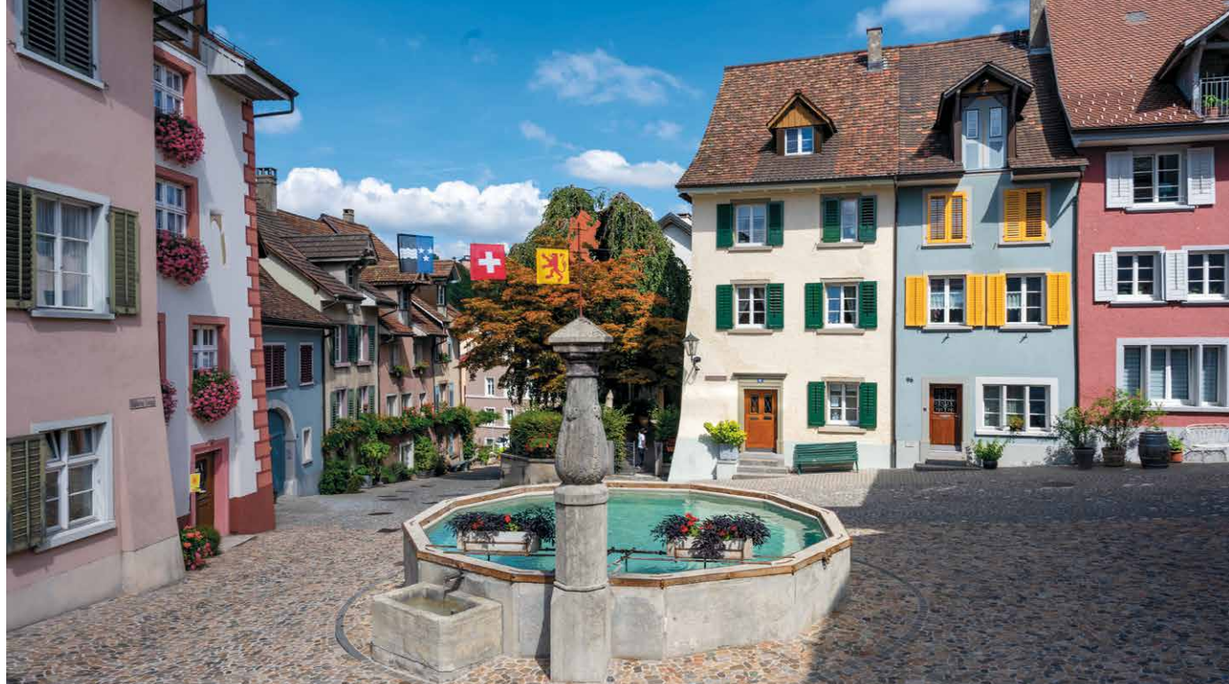
La vieille ville de Laufenburg est un bijou, mais manque parfois d'animation.