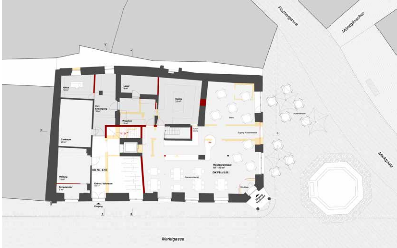
Rénové, le restaurant affirmera davantage sa présence dans l'espace public.