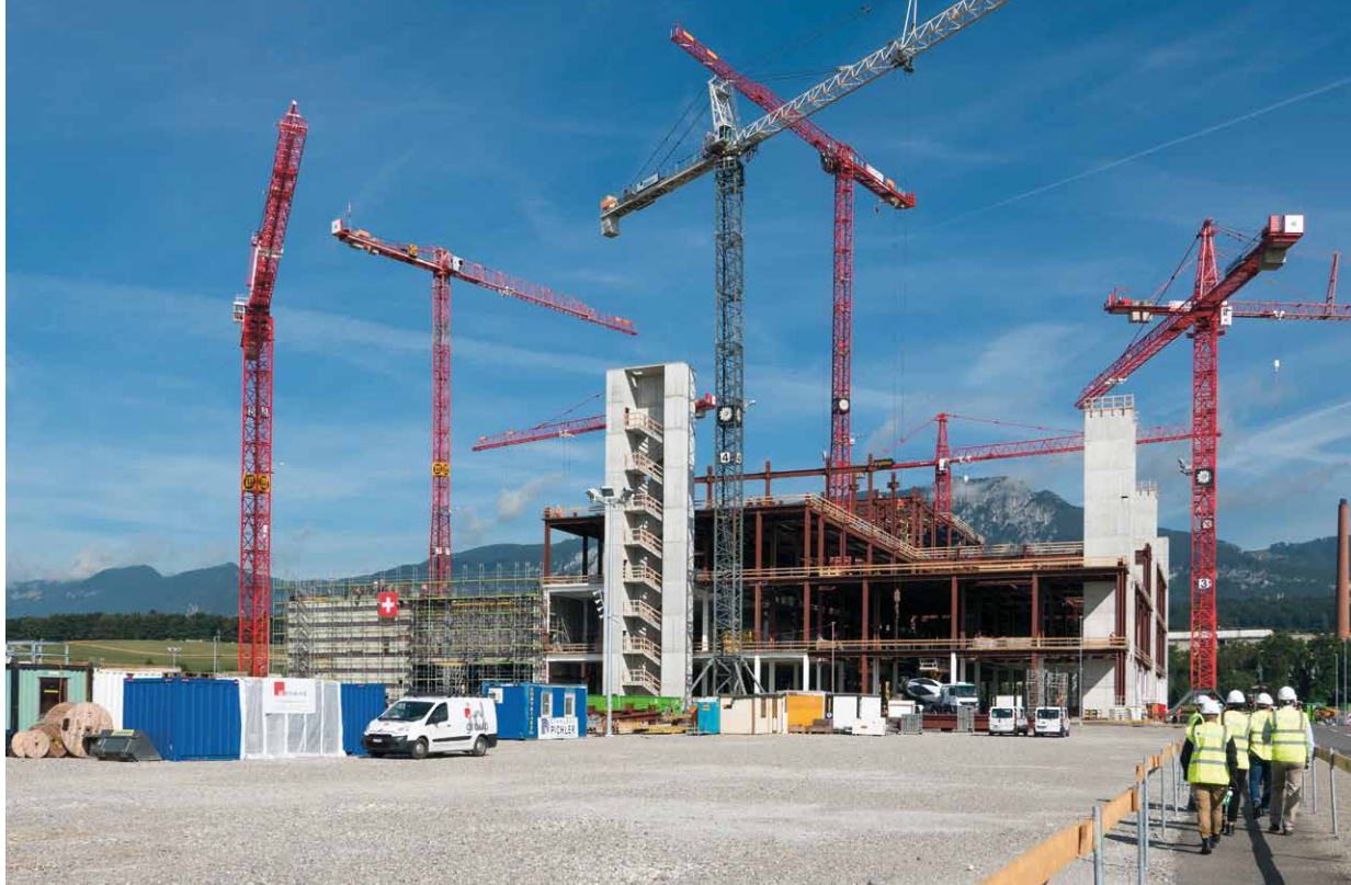
Le développement du site d'Attisholz à Riedholz, issu de la politique foncière active du canton de Soleure, est un projet phare qui rayonne au-delà des limites cantonales.

toutes les localités. L'important, c'est que celles-ci disposent d'outils adaptés à leur propre situation et qu'elles agissent en conséquence. Dans une commune, passer en force n'est pas possible. L'approbation de la population est indispensable, d'autant qu'il s'agit toujours, en fin de compte, de l'argent des contribuables. L'exécutif communal doit s'assurer du soutien des citoyens.